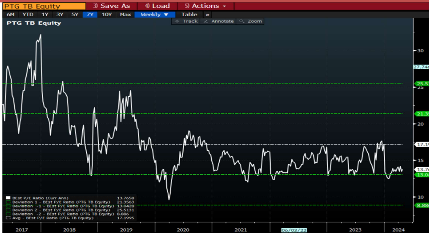
Figure 2 : PTG PER Band